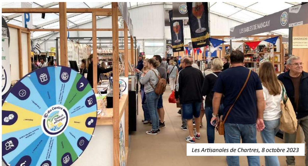
Les Artisanales de Chartres, 8 octobre 2023

Ce mardi 25 juin, au domaine La Porte Dorée à Cheverny (Loir-et-Cher), la marque régionale « Produit en Région © du Centre » réunit ses adhérents et partenaires pour la 7ème édition de ses Rencontres annuelles. Point d'orgue de la marque des produits locaux de qualité, ce rendez-vous privilégié sera l'occasion de faire le point sur l'activité de © du Centre, de revenir sur les évolutions apportées pour répondre aux attentes de ses membres et de dévoiler les nouvelles actions de promotion qui marqueront le second semestre 2024, à l'instar de la Tournée d'été, véritable coup de projecteur sur © du Centre au plus près des consommateurs et au cœur des territoires.