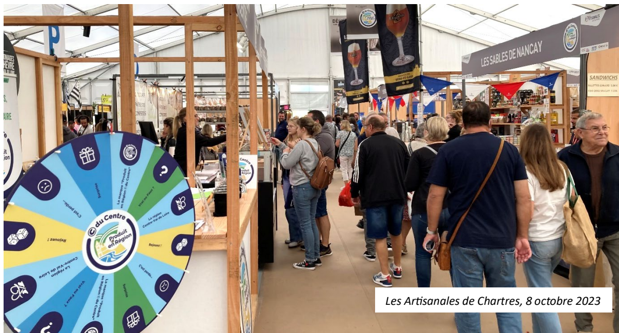
Les Artisanales de Chartres, 8 octobre 2023

Ce mardi 25 juin, au domaine La Porte Dorée à Cheverny (Loir-et-Cher), la marque régionale « Produit en Région © du Centre » réunit ses adhérents et partenaires pour la 7ème édition de ses Rencontres annuelles. Point d'orgue de la marque des produits locaux de qualité, ce rendez-vous privilégié sera l'occasion de faire le point sur l'activité de © du Centre, de revenir sur les évolutions apportées pour répondre aux attentes de ses membres et de dévoiler les nouvelles actions de promotion qui marqueront le second semestre 2024, à l'instar de la Tournée d'été, véritable coup de projecteur sur © du Centre au plus près des consommateurs et au cœur des territoires.