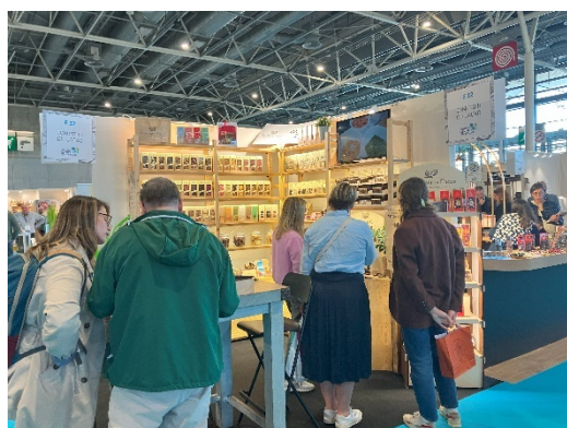
Photo stand - édition 2024